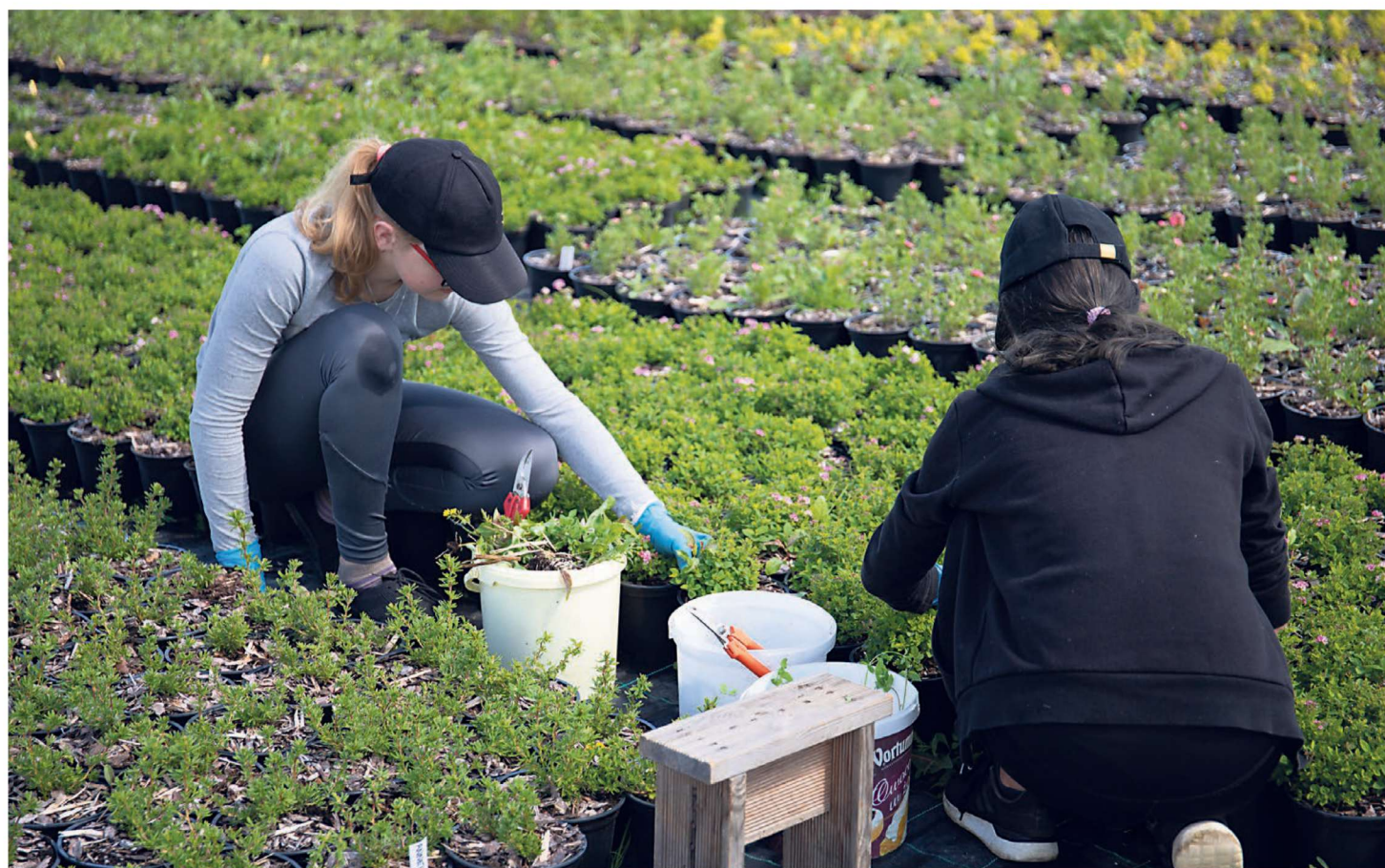
Piiriveere maleva maleva 30 noort tegutsevad kolmes eri rühmas Rāpinas, Vārskas ja Meremäel. Rāpinas töötavad noored ASi Plantex aiandis, kus nad rohvivad ilu- ja puukoolitaimi ning teevad teisi jõukohaseid töid.

Malev ei tähenda aga ainult töötegemist: kahe nädala sisse mahub ka Piiriveere ja Tankla õpilasmaleva rühmade kokkutulek Valgamaal Kuutsemäel. Kuna malev on ööbimisega, siis esimesel nädalal valmistuvadki malevlased pärast tööd suurelt jaolt kokkutulekuks.