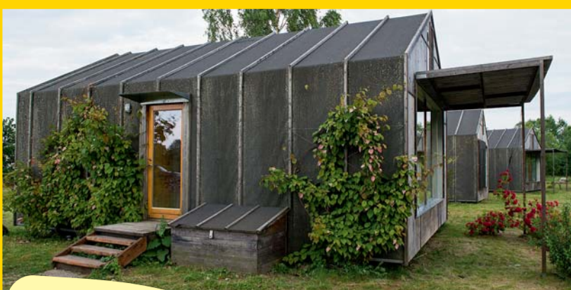
Näin küla põhumajad – lihtsasse vormi valitud moodas okopead – rajatavad loodusohudiku rändajad Peipsi ääres ümber Jõgevamaa piiri. August 2014. Tartumaa.