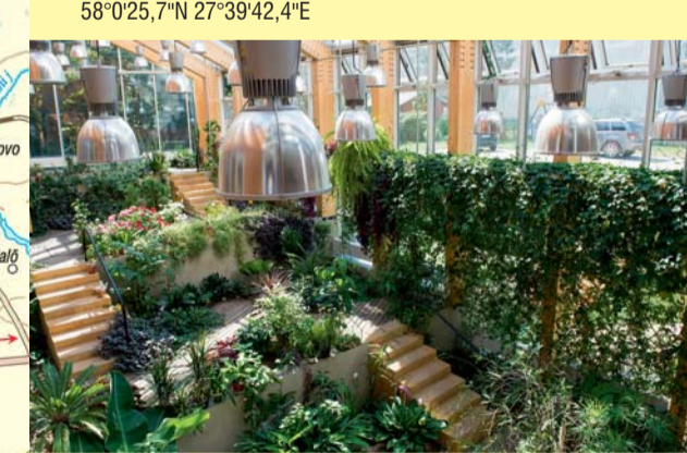
Tartu loodusmaja moodustas koos Tartu loomemajanduskeskusega inspireerivalt loominguilise kvartali taaralinnas. August 2014. Tartumaa.