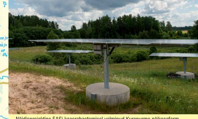
Nädisprojektsina EASI kaasrahastamisel valminud Kurenurme päikeselarn otatab juba üle aasta võrkulitarnist. Juuli 2014, Võrumaa.

Koostaja ja väljandis: Tartumaa Arenduskeskus, 2014 Tekstid: Erkki Peetsalu Kujundus: Triinu Sarv / Kaart: AS EOMAP / Trükk: Paar OÜ