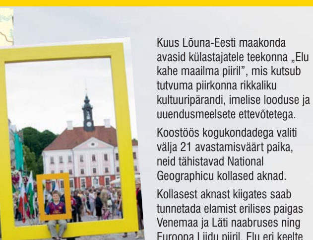
Tere tulemast Lõuna-Eestisse!

Kuus Lõuna-Eesti maakonda avasid külastajatele teekonna „Elu kahe maailma piiri”, mis kutsub tutvuma piirkonna rikkaliku kultuuripärandi, imelise looduse ja uendusmeelsete ettevõtetega. Koostöös kogukondadega valiti välja 21 avastamisväärt paika, neid tähistavad National Geographici kollased aknad. Kollasest aknast kiigates saab tunnetada elamist erilises paigas Venemaa ja Läti naabruses ning Euroopa Liidu piiri. Elu eni keelte ning erinevate kultuuride, mõteteviside ja maailmavaadete keskide pakub alati üllatusi ja avastamisrõõmu. Lõuna-Eestit tutvustav koostööprojekt on ühtlasi üks neist alustest, millega tähistati 125 aasta möödumist ajakirja National Geographic asutamist. Oleme innovatsioonihülisele külastajale valitud välia pönevad ja avastamisväärt paigad Lõuna-Eestis. Vail endale sobiv teekond ja tule külla!